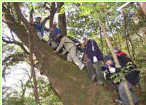
高知新聞に掲載された幹回り5mを超すアカガシ この事業には当森と緑の会から助成しています

平成19年2月4日(日)、須崎緑と水の会が四万十町観光協会と共催で四万十町と梶原町にまたがる久保谷風景林の巨木調査を実施。午後は参加者30名が二手に分かれて調査を開始。幹周り3mを超す巨木の発見に興奮の連続。次は、25日(日)に行う予定です。