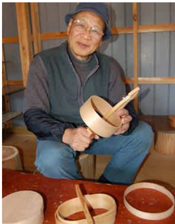
これが曲げわっぱ。ほのかに香る杉と手触りが何とも言えません。

もともと杉の曲げわっぱと言えば、秋田杉製が有名ですが、秋田杉にも劣らない馬路村が誇る地元の魚梁瀬杉で作る曲げわっぱ。木の良さと昔からの知恵の詰まった製法を体験するメニューとして人気が高いです。