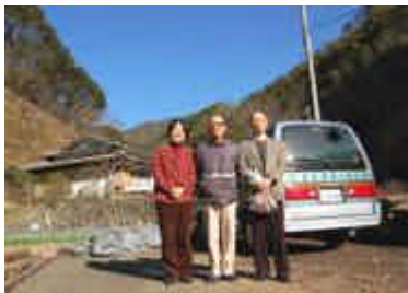
賞状の伝達で訪問しました

十和で育つ椎茸は味、食感、香り、品質も抜群です。この椎茸栽培が続くようみんなで応援できたら、と思いました。